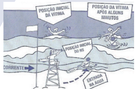
Procedimento de acção para resgate do nadador